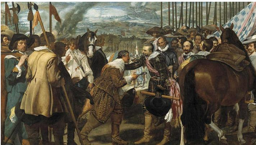
Imatge 5. Velázquez. La rendició de Breda . Museu Nacional del Prado, Madrid, 1630-1635. Imagen 5. Velázquez. La rendició de Breda . Museo Nacional del Prado, Madrid, 1630-1635.