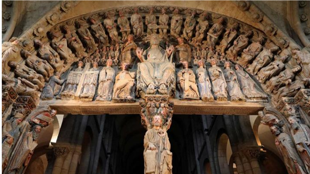
Imatge 2. Pòrtic de la Glòria. Catedral de Santiago de Compostel·la Imagen 2: Pórtico de la Gloria. Catedral de Santiago de Compostela